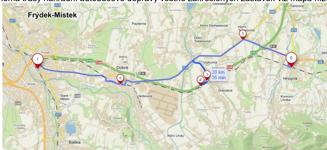
Schéma trasy náhradní autobusové dopravy včetně zakreslených zastávek viz mapa níže.

Při návrhu bylo vycházeno z místních zvyklostí a již proběhlých výluk.